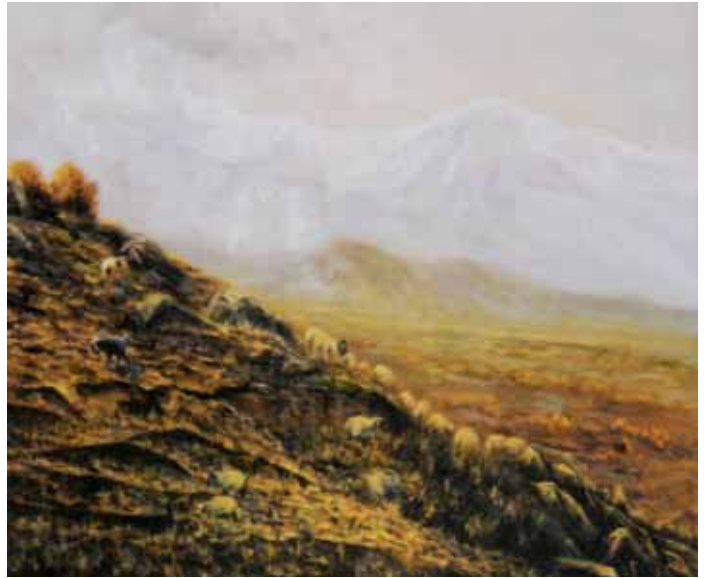
دامنه کوه، سیروس آرام ۶۰×۴۵