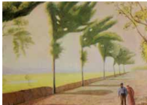
یوسف رجیبی ۶۰×۸۰