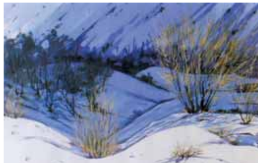
زمستان، تقی حجاریان ۸۰×۶۰