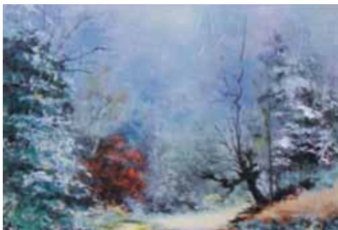
طبیعت، حمید معصومی ۵۰×۷۰