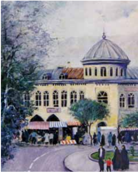
میدان امام، تقی حجاریان ۸۰×۶۰