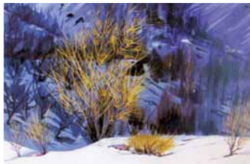
زمستان، تقی حجاریان ۹۳×۷۰