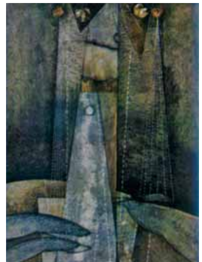
غلامرضا شاملو ۱۰۰×۷۰