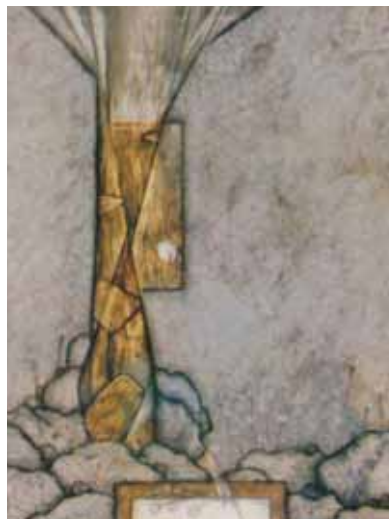
غلامرضا شاملو ۱۰۰×۷۰