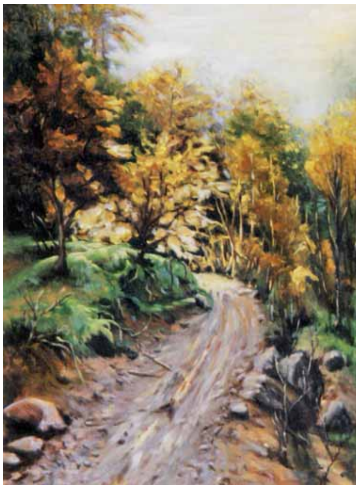
کوچه باغ، مرید علی مومیوند ۴۰×۳۰