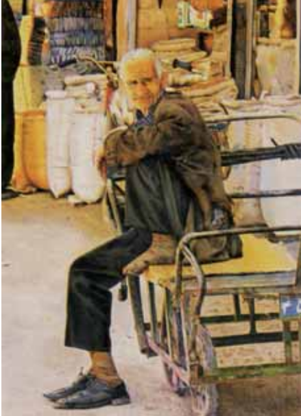
بازار محمد زائری زاده همدانی ۶۰×۹۰