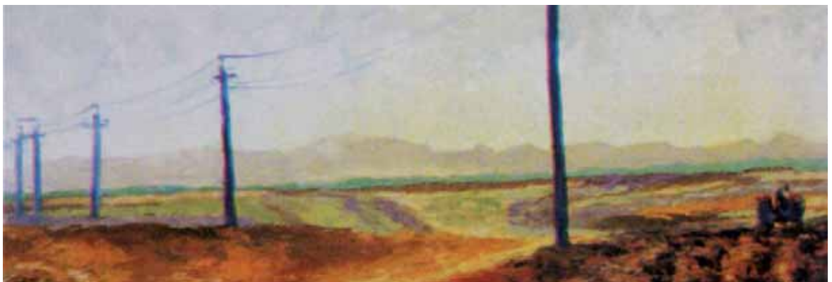
افق، علی شهبازی ۱۶۰×۴۰