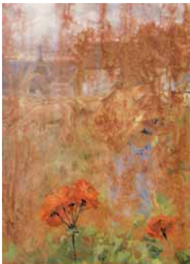
علی شهبازی ۱۲۰×۸۰